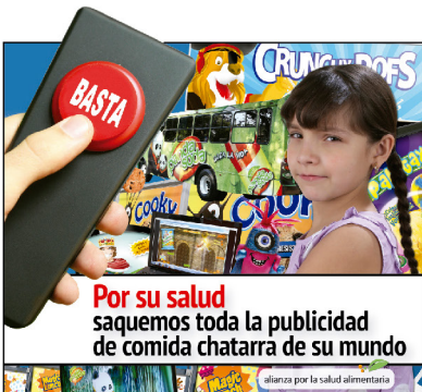
Imagen de la campaña en medios masivos "Nuestros niños son primero", que exige la prohibición de toda la publicidad de comida chatarra y bebidas azucaradas dirigida a la infancia en México.